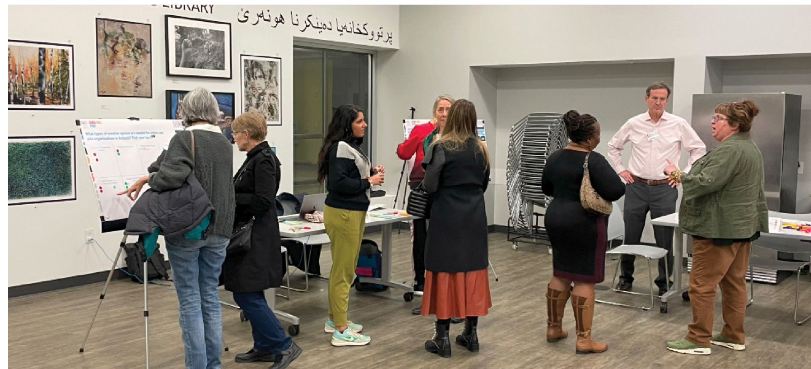
Fig. 1-5. Los talleres comunitarios brindaron la oportunidad de explorar ideas con mayor detalle, incluidos espacios comerciales compartidos, viviendas para artistas y servicios comunitarios.