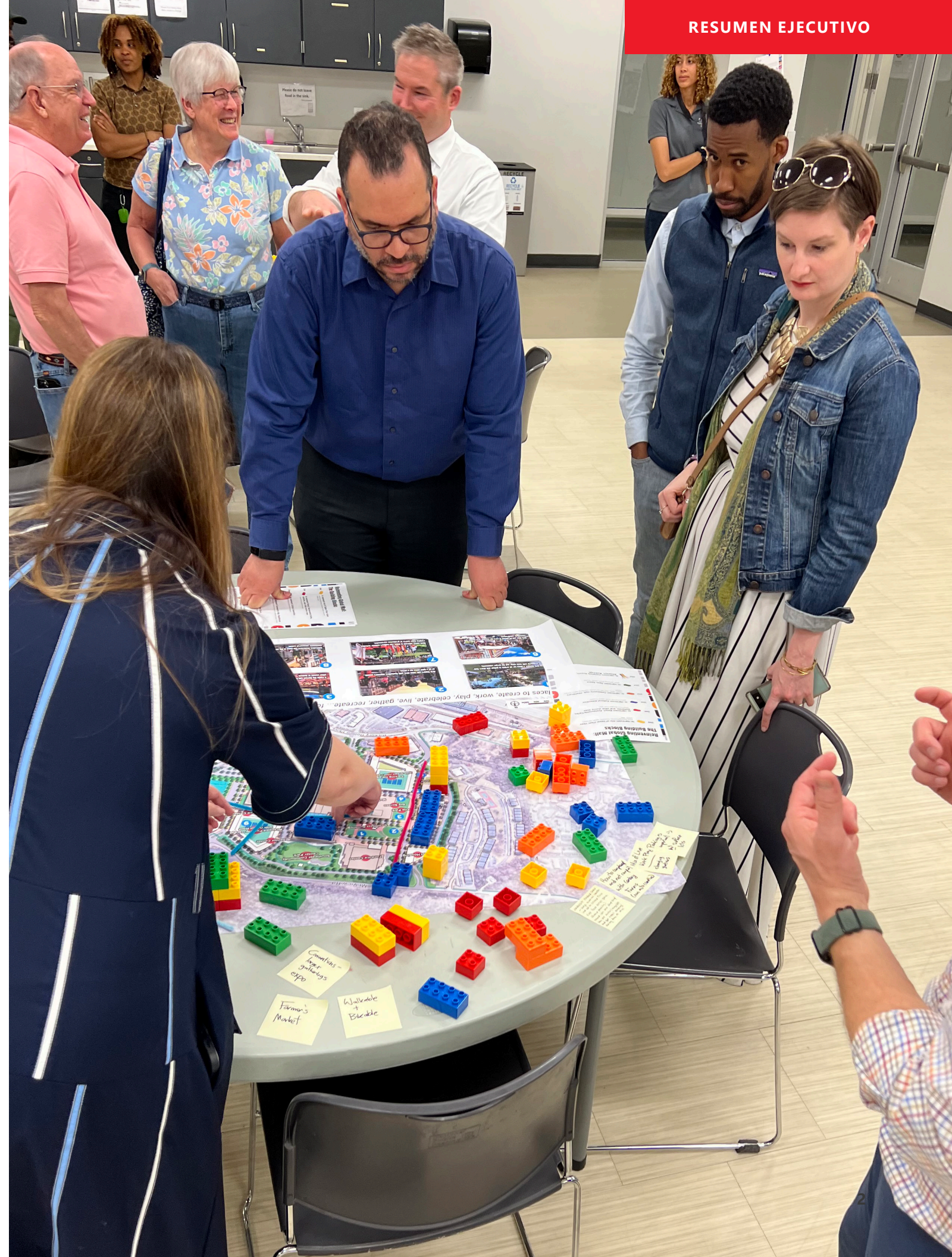
Fig. 1-1. Los residentes de Antioch apoyan a la comunidad de artes e innovación, lo que ayudará a cultivar y elevar los numerosos talentos y perspectivas culturales de la comunidad.

Es probable que las viviendas y el comercio minorista relacionado lleguen al sitio en una etapa temprana del proceso de desarrollo. El entorno transitable y rico en comodidades que estos usos ayudan a crear atraerá a su vez empleos e inversiones. Todos estos usos serán altamente compatibles con la biblioteca, el centro comunitario, el colegio comunitario y la escuela KIPP que ya están ubicados en el sitio. Estos usos existentes de tipo servicio comunitario también desempeñarán un papel fundamental en la capacitación del talento local para incrementar el atractivo del sitio para los empleadores.