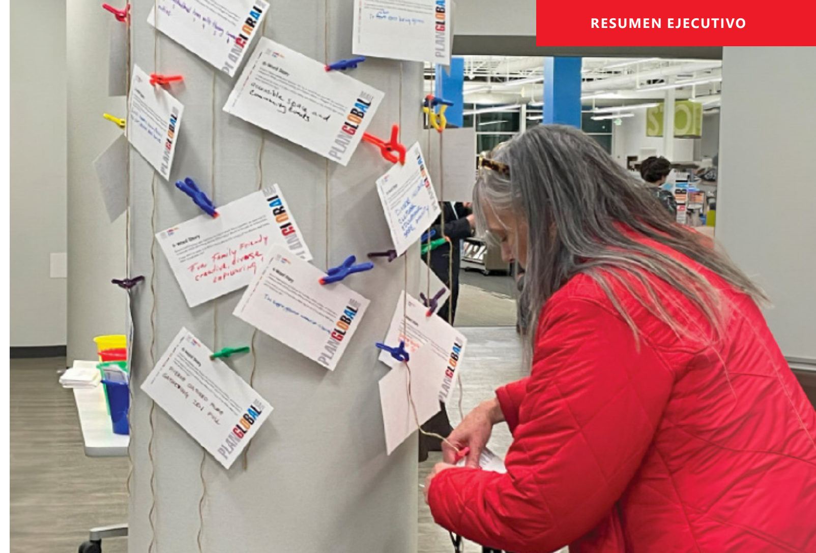
Fig. 1-2. Los residentes de Antioch crearon una visión colectiva en el primer taller comunitario que guiará la transformación del sitio Global Mall en un centro de actividad comunitaria transitable y de uso mixto.

El distrito estará anclado por dos calles emblemáticas bordeadas de árboles (a las que en este plan se hace referencia como Camino de las Artes (Arts Way) y Bulevar de la Innovación (Innovation Boulevard), que a su vez se complementarán con tres espacios públicos prominentes: Verde Central, donde el distrito y las comunidades circundantes pueden reunirse para llevar a cabo reuniones formales e informales; el parque comunitario existente que respalda la biblioteca y el centro comunitario y puede servir como parque vecinal para el distrito y Antioch; y la Plaza de las Artes (Arts Square), que presenta una oportunidad para que la comunidad de Antioch celebre la cultura viva de Nashville con la comunidad en general. En todos los casos, estos espacios públicos—y las redes de movilidad que los conectan—deben incluir estrategias de creación de lugares que incorporen programas de arte locales y otras comodidades que respalden un entorno seguro y confortable. Se debe considerar un Distrito de Mejoramiento Comercial (BID) u otra entidad para apoyar la programación y el mantenimiento.