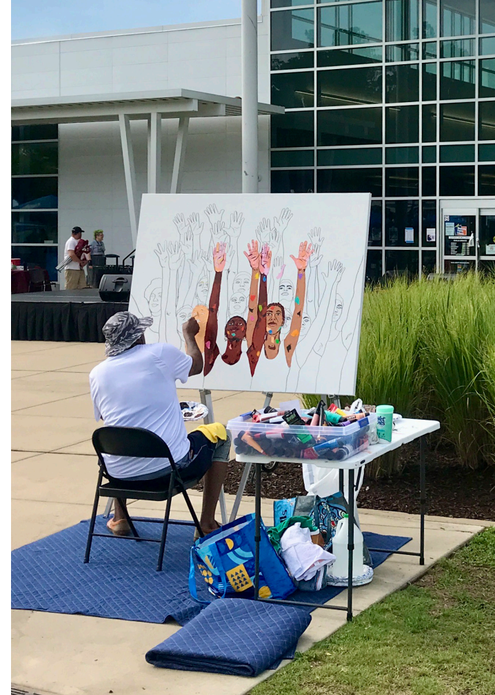
Fig. 1-3. Los usos comunitarios y grandes espacios públicos atraerán visitantes de toda la región.

Además, el distrito requerirá una gestión sólida para garantizar que su ámbito público esté completamente programado y que su promesa como nuevo destino regional importante perdure en las próximas décadas.