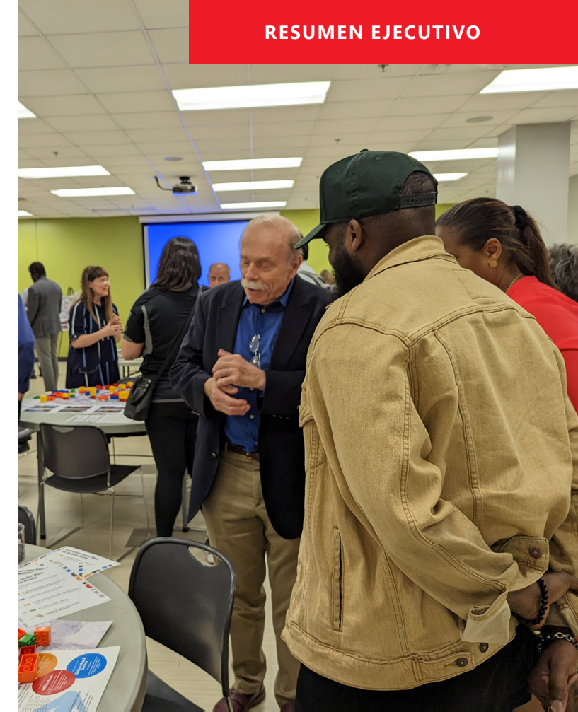
Fig. 1-4. La visión del futuro sitio de Global Mall surge del compromiso con la comunidad de Antioch.