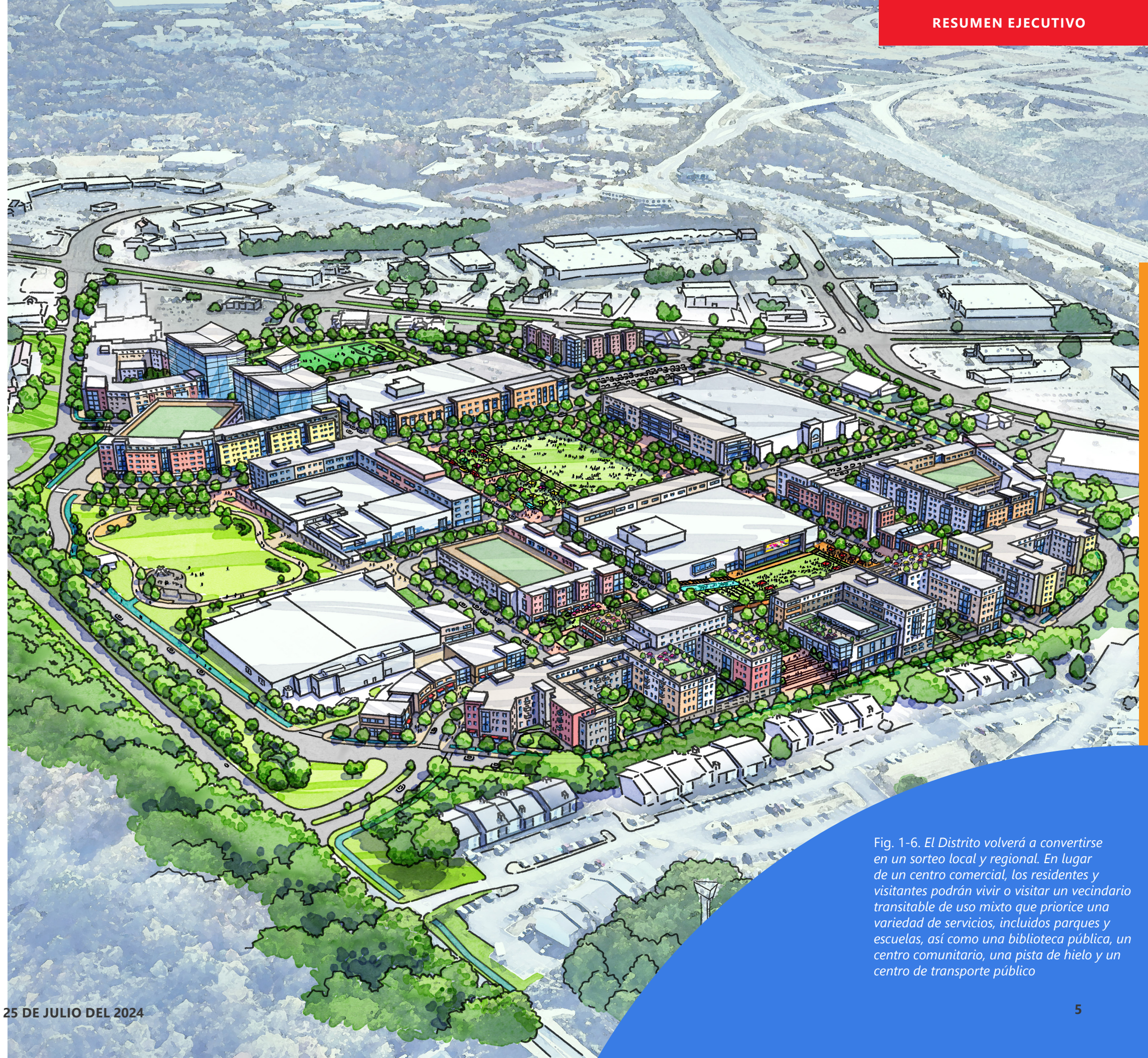
Fig. 1-6. El Distrito volverá a convertirse en un sorteo local y regional. En lugar de un centro comercial, los residentes y visitantes podrán vivir o visitar un vecindario transitable de uso mixto que priorice una variedad de servicios, incluidos parques y escuelas, así como una biblioteca pública, un centro comunitario, una pista de hielo y un centro de transporte público